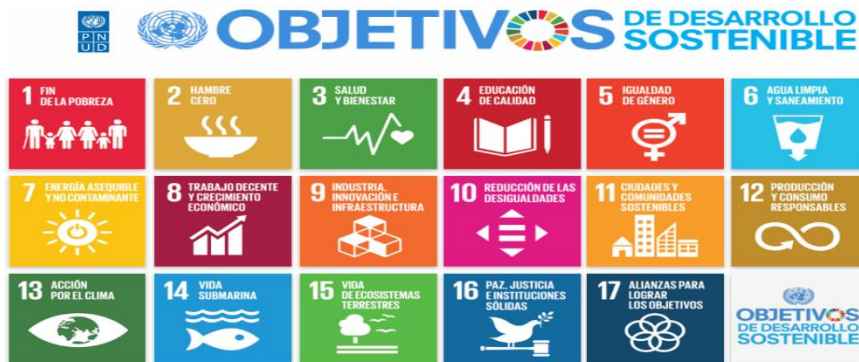
Ilustración 1 Objetivos de Desarrollo Sostenible ODS