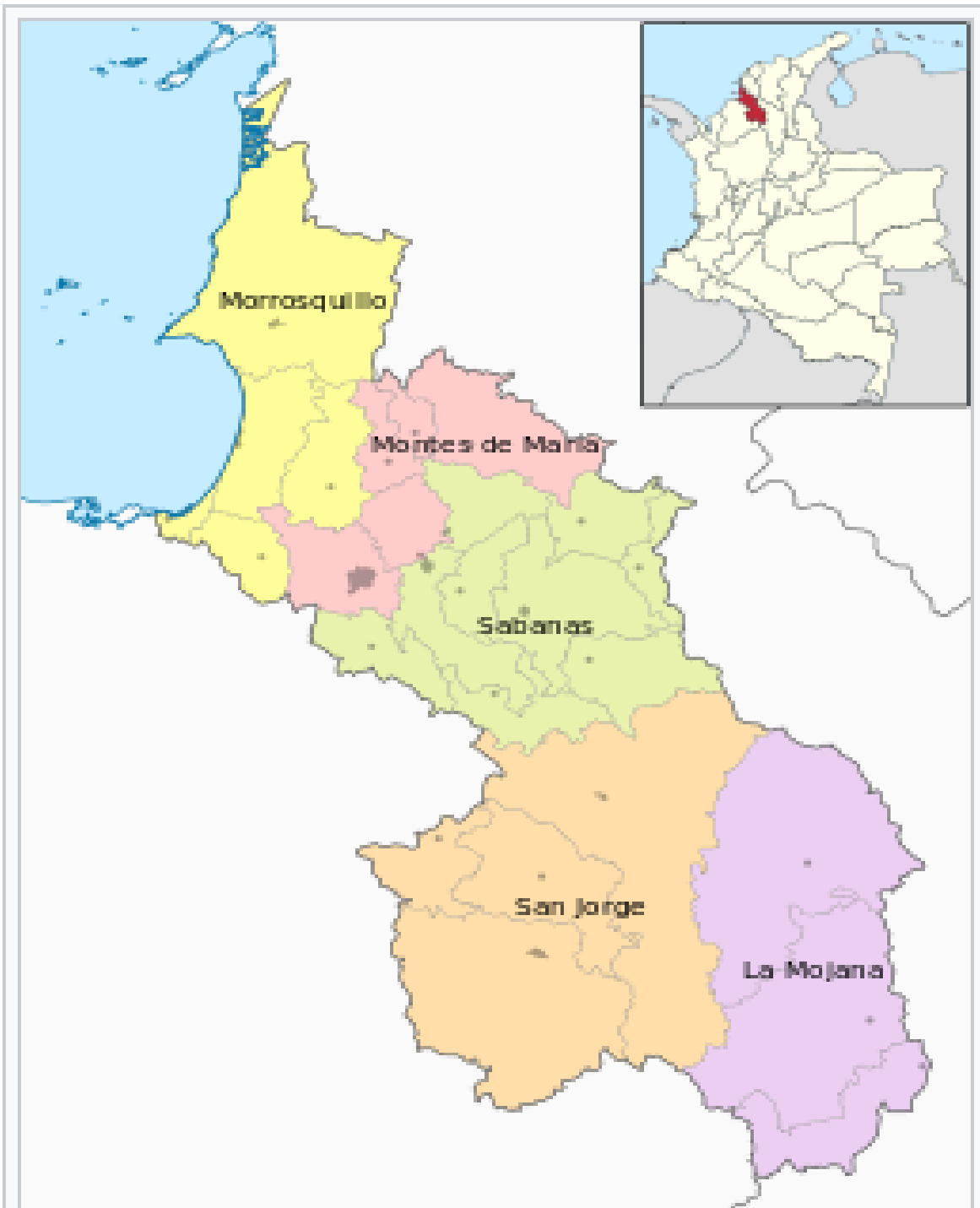
Subregiones de Sucre.