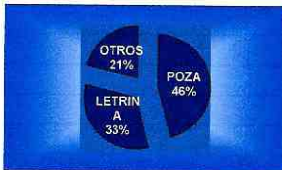
SISTEMA DE ELIMINACION DE ECRETAS